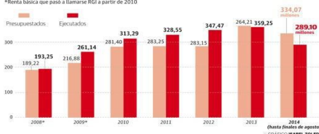
GRÁFICO ISABEL TOLEDO

*Renta básica que pasó a llamarse RGI a partir de 2010